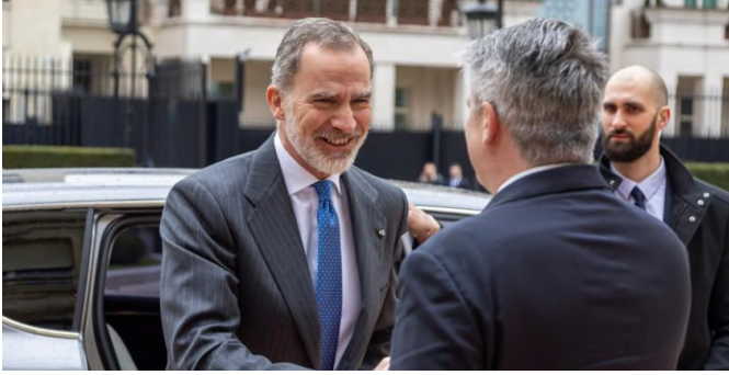
SM Felipe VI saluda al secretario general de la OCDE, Mathias Cormann.- París 10/03/2023.