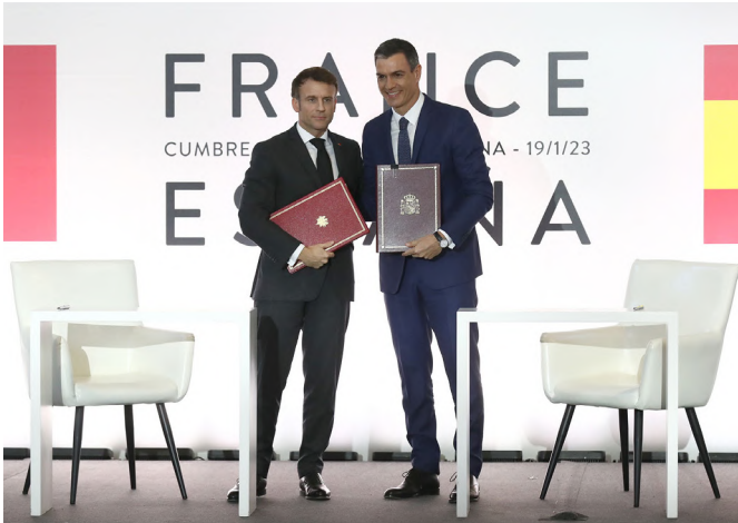
El presidente de Francia, Emmanuel Macron (i) y el presidente del Gobierno, Pedro Sánchez (d), posan tras la firma de un Tratado de Amistad entre sus respectivos países, durante la XXVII Cumbre Hispano-Francesa – 19-01-2023