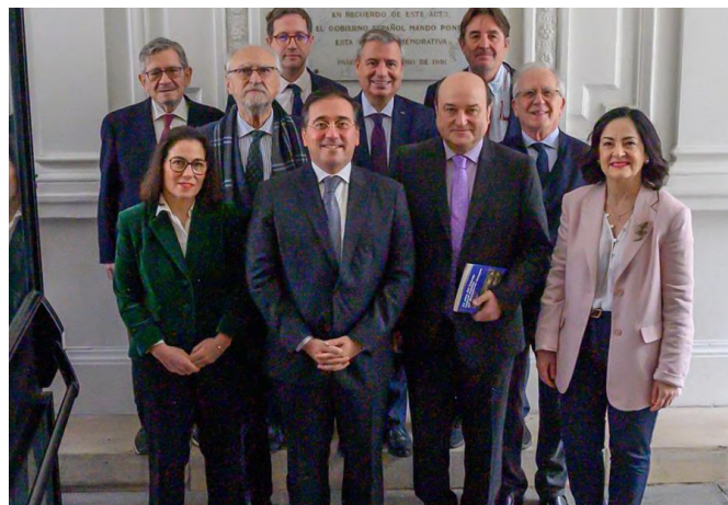
D. José Manuel Albares, en el acto conmemorativo del 75º aniversario de la creación del Consejo Federal Español del Movimiento Europeo.-París, 9 de febrero de 2024.- foto: MAEUC

Correo electrónico: reper.paris@minetad.es