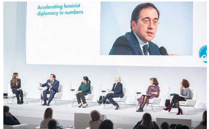
El ministro de Asuntos Exteriores, Unión Europea y Cooperación, José Manuel Albares, en el Foro de la Paz de París.- París 11/11/2022.