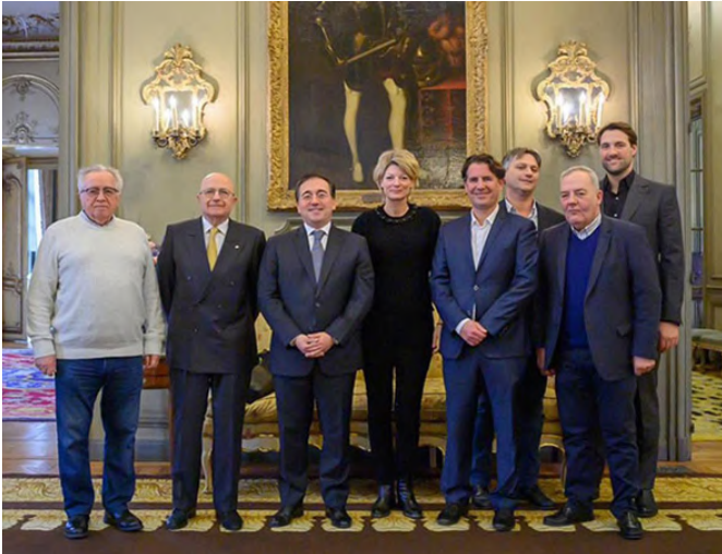
Foto de familia de la reunión del ministro José Manuel Albares con los importadores de productos alimentarios y hortofrutícolas españoles. -París, 09/02/2024.

de inversión, los más relevantes son el suministro de energía eléctrica, gas, vapor y aire acondicionado, programación y consultoría, las actividades de construcción especializada, reparación e instalación de maquinaria (4%) y la industria de la alimentación.