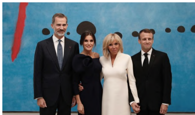
SS.MM los Reyes junto a SS.EE el presidente de la República Francesa, Emmanuel Macron, y la primera dama, Brigitte Macron. París, 5 de octubre de 2018.