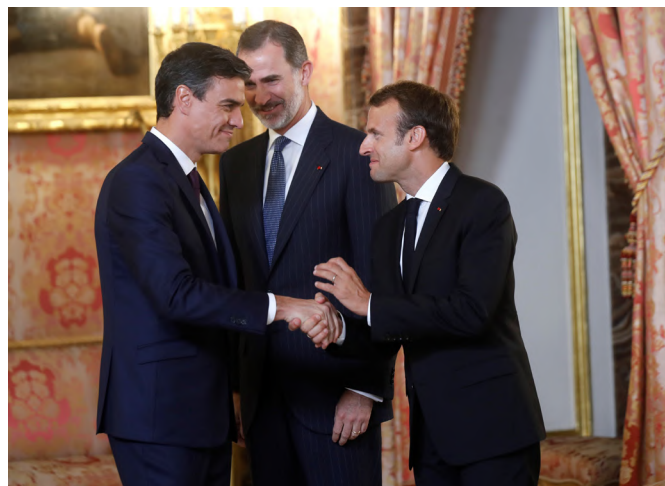
El presidente de Francia, Emmanuel Macron, junto al rey Felipe VI, saluda al presidente del Gobierno español, Pedro Sánchez, durante la reunión que mantuvieron el martes 26 de julio de 2018 en el Palacio Real de Madrid.

Francia es el primer cliente de España en el mundo. Como proveedor, ocupa el tercer lugar, tras Alemania y China. En 2023, las exportaciones españolas con destino Francia ascendieron a 60 MM€ y las importaciones representaron 40 MM€. El saldo comercial es por lo tanto favorable a España, con un superávit de 20 MM€. La automoción absorbe una gran parte de los flujos