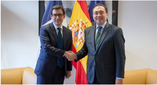
El ministro de Asuntos Exteriores, José Manuel Albares junto a su homólogo francés, Stéphane Séjourné.- Bruselas, 23-01-2024.