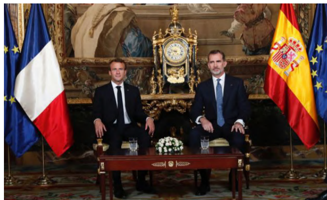
SM el Rey Felipe VI junto al presidente de la República francesa, Emmanuel Macron.- Palacio Real de Madrid, 26.07.2018.