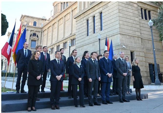
Foto de familia de Pedro Sánchez y Emmanuel Macron junto a las delegaciones española y francesa –Barcelona Museo Nacional de Arte de Cataluña (MNAC) 19.1.2023.